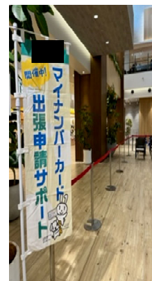
チラシやポスターの作成～配布、掲示