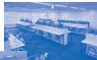
開放的なリフレッシュルーム